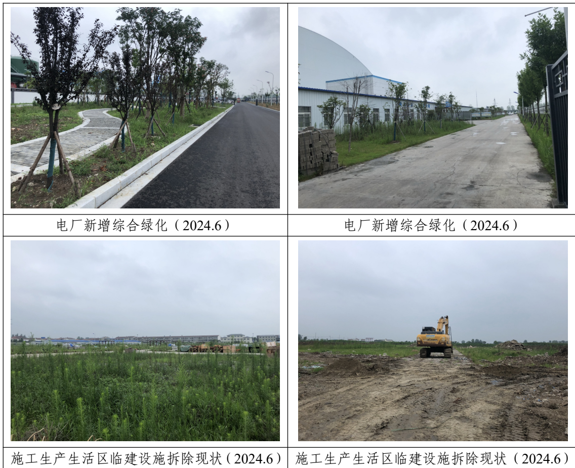
表 3-6 本季度实施水土保持措施示例